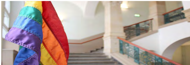
Gender and Queer Studies* (Master)

* Kooperationsstudiengang mit der Uni Köln