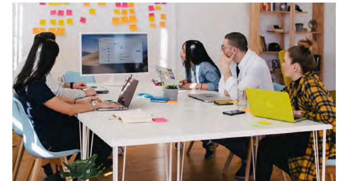
Visionen der Zukunftsgestaltung