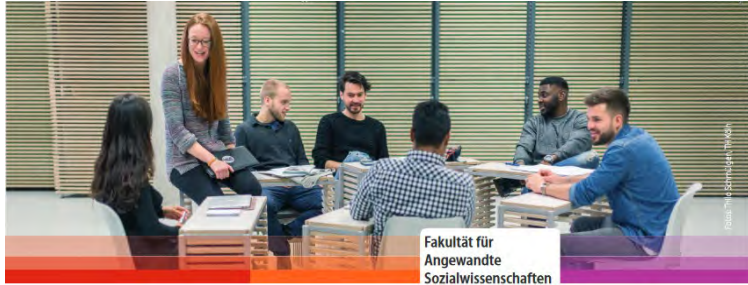
Soziale Arbeit - Bildung und Organisation (Master)