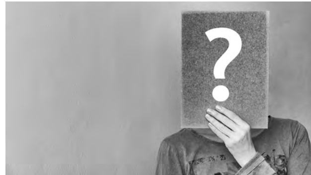
Interesse an sozialwiss. Fragestellungen