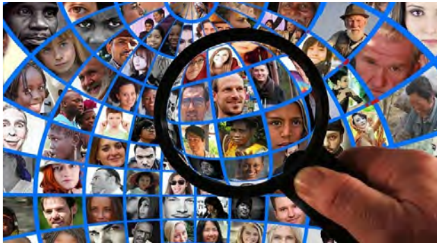
Interesse an der Arbeit mit Menschen