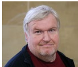
Bernhard Wilmes E-Learning